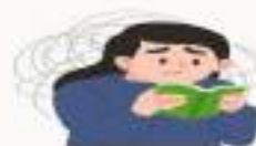
Falta de concentração